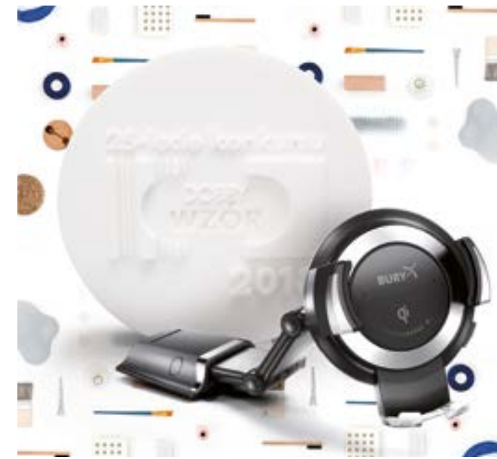
POWERKIT Qi - ausgezeichnetes Produkt.

Die Intention des Wettbewerbes ist es, Produkte und Dienstleistungen auszuzeichnen, für die eine hohe Designqualität charakteristisch ist. Des Weiteren sollen die Unternehmen und Preisträger beim Vertrieb Ihrer Produkte und Leistungen unterstützt werden. An der diesjährigen Jubiläumauflage des Wettbewerbes nahmen 193 Produkte von verschiedensten Unternehmen teil – unter ihnen wurden dann die 119 Finalisten gewählt. Zum engen Kreis der Produktfinalisten gehörte auch der universelle Smartphone-Halter POWERKIT Qi mit kabelloser Ladung und USB-Ladeport von BURY. In der Kategorie „Neue Technologien“ konnte das Produkt die Jury voll und ganz überzeugen und den Preis für sehr gutes Design gewinnen. Ausschlaggebende Kriterien für die Jury waren insbesondere die Verbindung von fortschrittlicher Technologie und zeitgemäßem Design in einem Produkt. Diese wichtigen Attribute sind die Basis für eine hohe Kundenzufriedenheit und der Garant für den Produkterfolg. Für BURY und vor allem für die projektbeteiligten Mitarbeiter war diese Auszeichnung eine Bestätigung ihrer Arbeit und ihres Engagements, ohne die der Gewinn des Preises nicht möglich gewesen wäre.