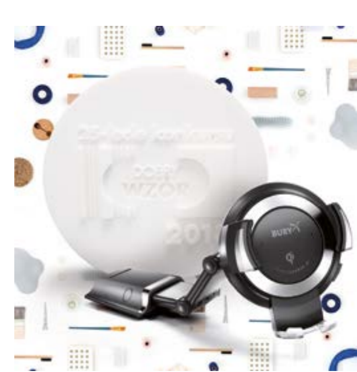
POWERKIT Qi - nagrodzony produkt.

Wręczenie statuetek odbyło się 24 października 2018 r. w Instytucie Wzornictwa Przemysłowego w Warszawie podczas